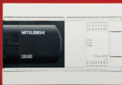
FX3GA-40MR-CM FX3GA-40MT-CM 输入 24 点 / 输出 16 点