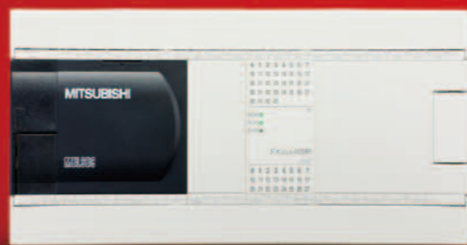
FX3GA-60MR-CM FX3GA-60MT-CM 输入 36 点 / 输出 24 点