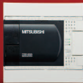
FX3GA-24MR-CM FX3GA-24MT-CM 输入 14 点 / 输出 10 点